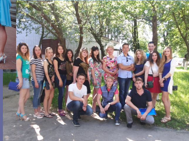
Дозвілля студентів спеціальності 071 «Облік і оподаткування»